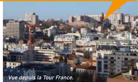
Vue depuis la Tour France.

Nous maîtriserons l'urbanisation dans les secteurs sensibles de la ville. Plutôt que de démolir pour reconstruire, nous soutiendrons les évolutions des constructions existantes : extensions, surélévations, rénovations. Les nouvelles opérations de logements seront développées sur les réserves foncières non utilisées plutôt que dans les quartiers déjà denses. Nous voulons une architecture plus contemporaine pour en finir avec la « disneylandisation » de la ville.