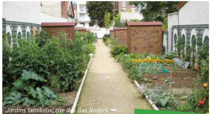
Jardins familiaux, rue des Bas Rogers

Au sein des écoles, des crèches, des maisons de retraite, les Putéoliens auront la possibilité de consommer bio à 100 % (contre 25 % à ce jour) au bénéfice de l'environnement et de leur santé .