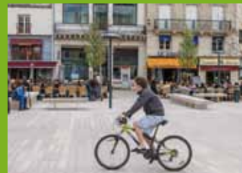
Poitiers, Place du Maréchal Leclerc.