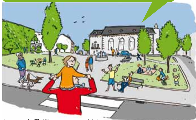
Le parc du Théâtre sera ouvert à tous.

Nous soutiendrons l'amélioration des transports en commun : fréquence augmentée sur le T2 en soirée et sur le Buséolien, bus à haut niveau de service . Un meilleur partage de la voirie permettra de réduire la vitesse, le bruit et la pollution et d'apaiser les ambiances pour que Puteaux devienne une ville marchable et cyclable . Un réseau de circulations douces sera créé et les cheminements piétons entre la ville et la Défense seront simplifiés. Des zones piétonnes dynamiseront les quartiers et le commerce (voir p. 6-7). Votre cadre de vie sera amélioré par la création d' espaces publics conviviaux et l' ouverture des jardins actuellement fermés au public.