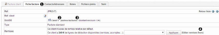
Figure 3 : Exemples de liens dans un tableau

Nous appellerons liens , les liens présents sur les pages de formulaires et dans les tableaux, renvoyant vers une fonctionnalité ou un document/écran lié.